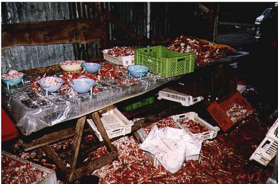
Procesamiento de centolla en clandestino