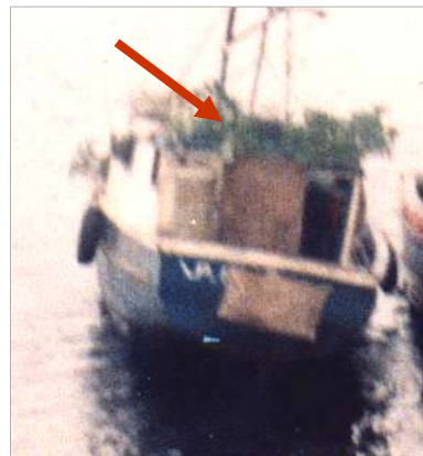
Incautación de recurso en embarcaciones camufladas Seno Año Nuevo, operativo con Armada de Chile.